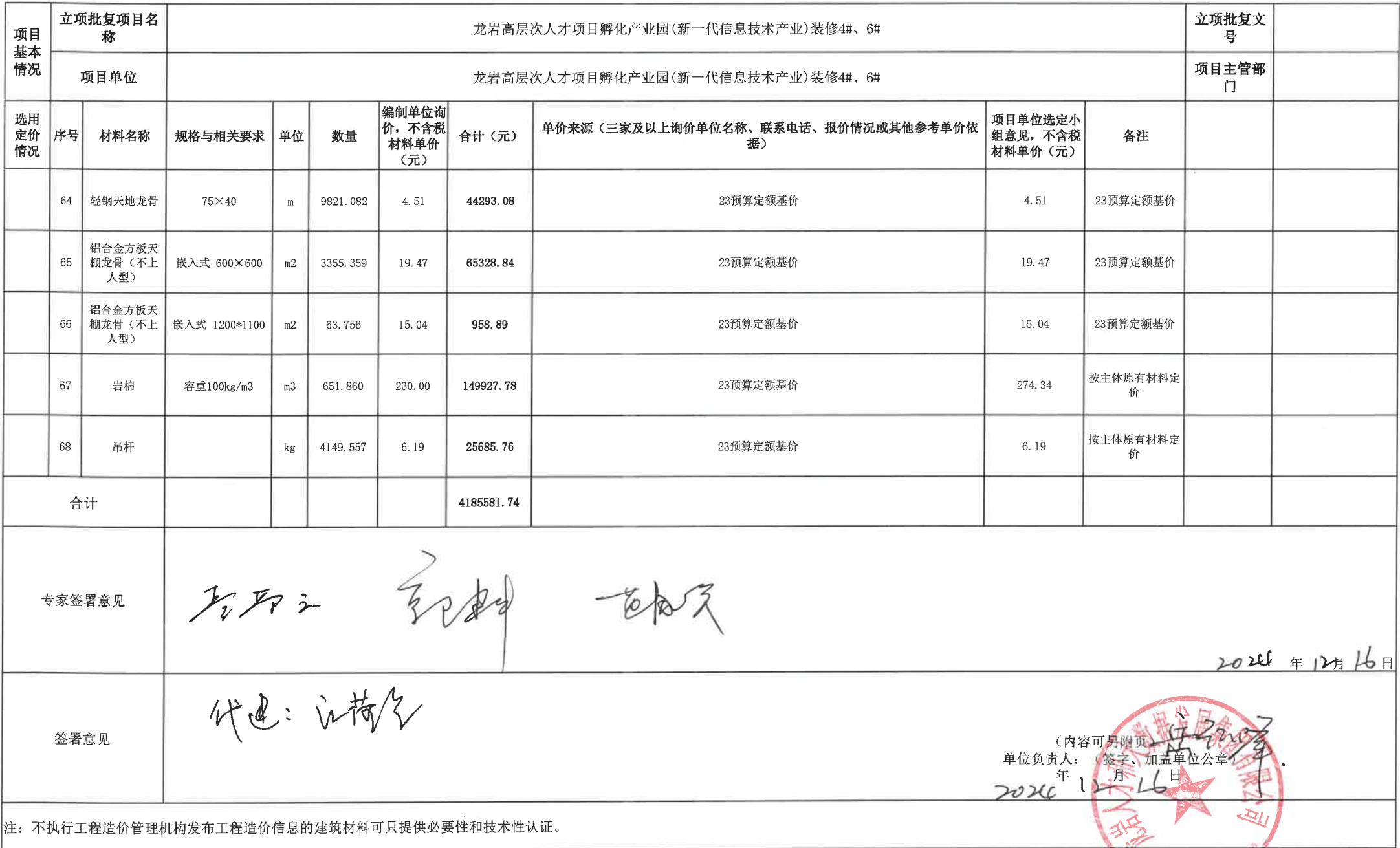
龙岩市本级财政投资建设项目缺项材料选用定价审批表

注: 不执行工程造价管理机构发布工程造价信息的建筑材料可只提供必要性和技术性认证。